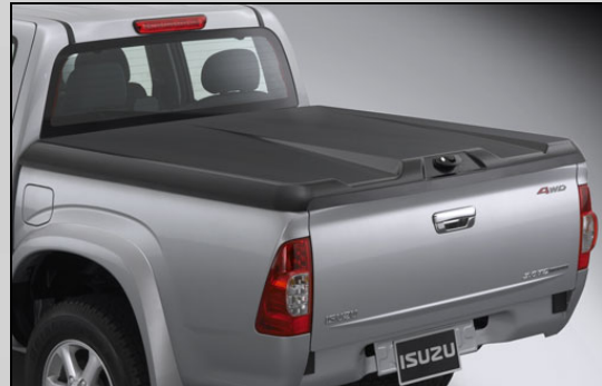
32 Super Lid