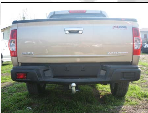
17 Anhängervorrichtung (nur für LS)