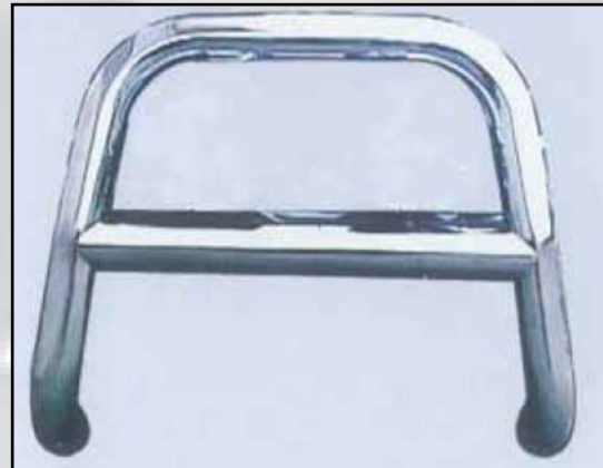
6 (Alt.2) Bull bar cromato (solo EURO 3)