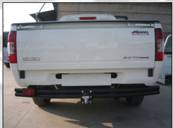
18 Anhängervorrichtung (nur für L)