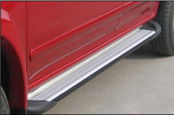
7 (Alt.1) Trittbrett crew