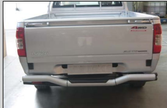
6 Bull bar (satinato)