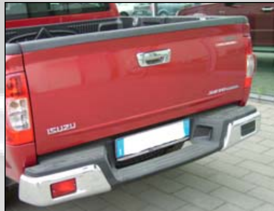
33 Verchromter stoßstagenschutz. (NUR LS)