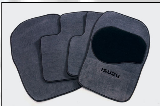
48 Teppich aus Moquette