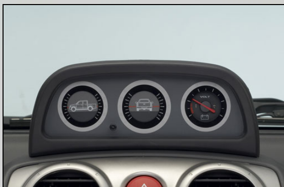
46 Neigungswinkel Anzeiger