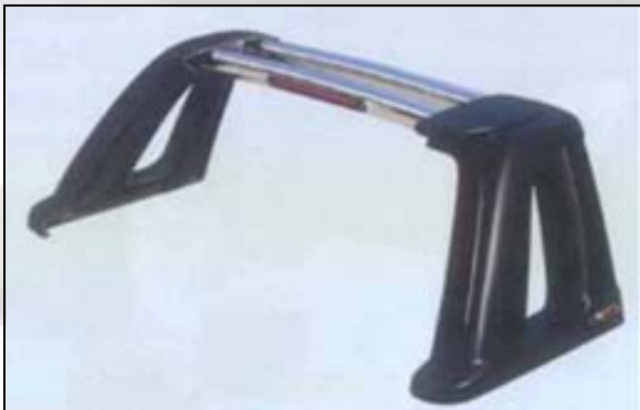
15 Roll Bar verchromt