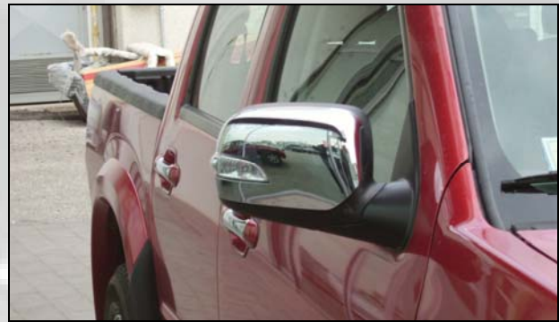
37 Verchromter aussenspiegel shutz (NUR LS)