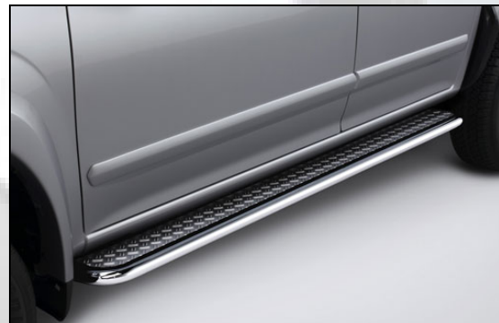
7 Trittbrett - Heavy Duty Type (A)