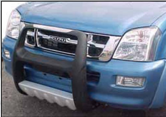
6 (Alt.1) Bull bar (solo EURO 3)