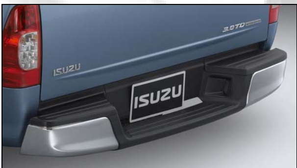
5 Stosstange hinten (nur für L)