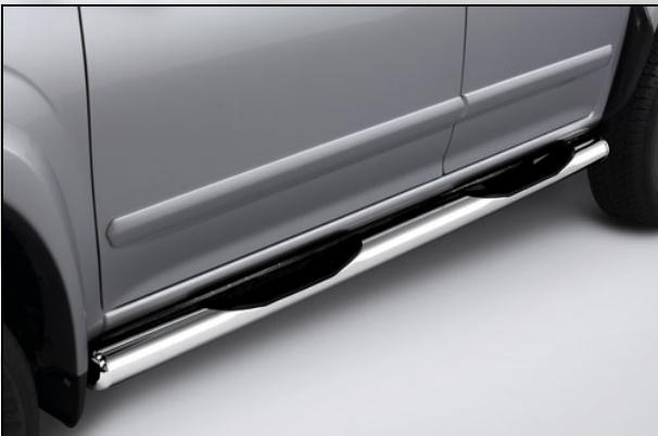
9 Rammschutz verchromt mit Stufe