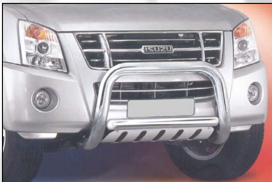
6 (Alt. 3 ) Bull bar (NUR EURO 4)