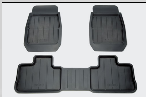
47 Gummit Teppich