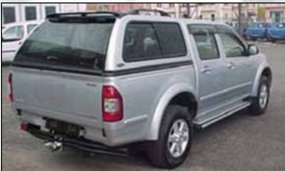
38 Hardtop Carryboy