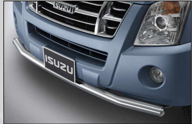
2 Vorder Stosstangenschoner