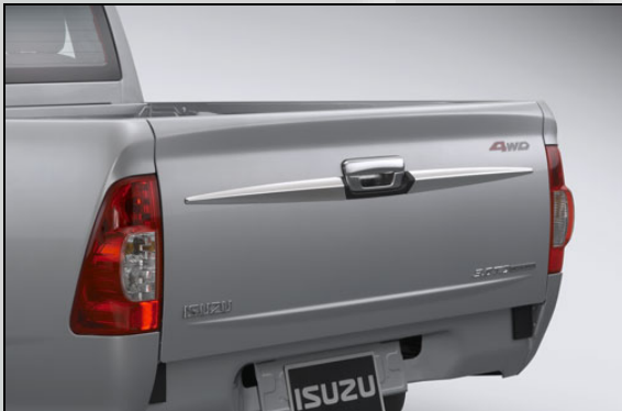
13 Verziehung hinten