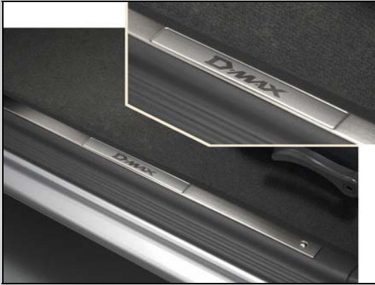
52 Absatzschutz (chrom)