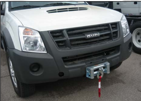
11 Hebewinde für D-Max