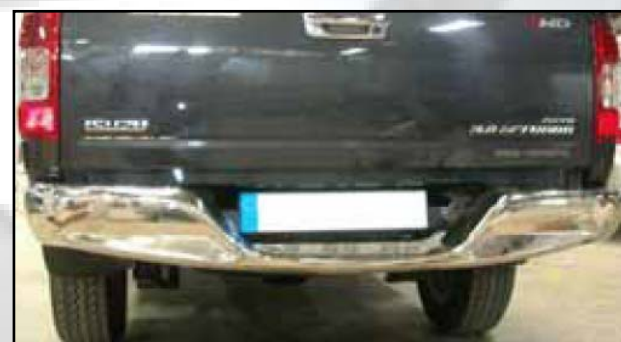
5 (Alt. 1) Stosstange hinten (Chrom nur für L)