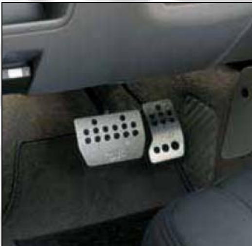
54 Pedalhebel (für Automatische Getriebe)