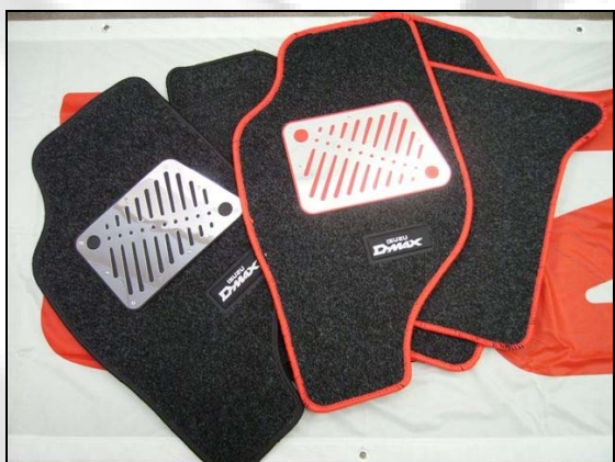
49 (Alt.) Tappeti Moquette (Nero o Rosso) Solo CREW