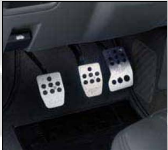
55 Pedalhebel (für Handschaltung)