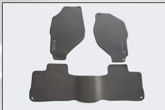
49 Teppich aus Moquette