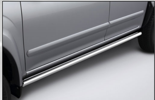
10 Rammschutz röhrenförmig