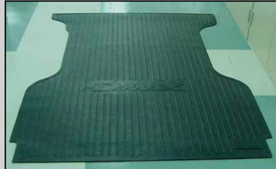
35 Tappeto coprivasca