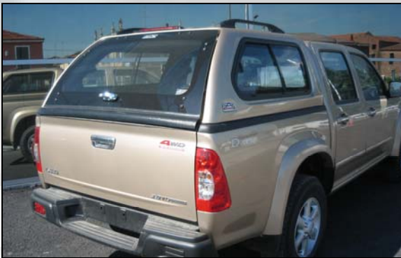
36 Hard top Vandapac