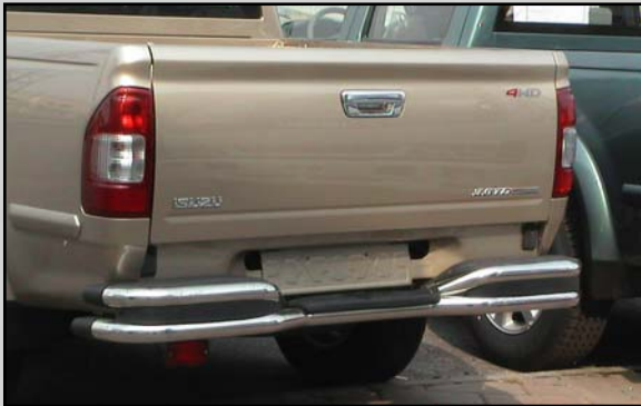
5 (Alt. 2) Paraurti posteriore (solo per L)