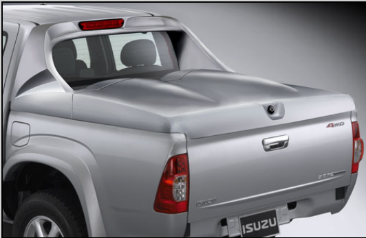
31 D – Box