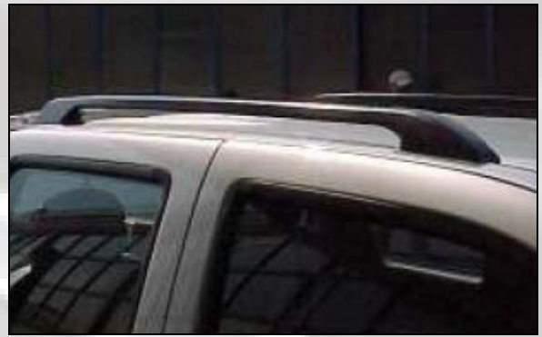
16 Dachhaltesstange nur grau