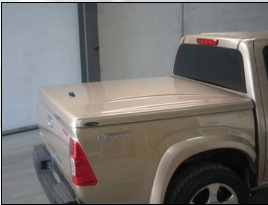
32 (Alt.2) Super Lid (modell ohne roll bar)